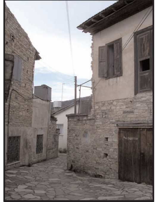
Lefkara köyü bugün hala nakış işleri merkezi durumundadır. Köylü kadınlar hala bu pitoresk köyde beyaz evlerinin dışına oturmakta ve nakış işleri yapmaktadırlar.

eratife işlemekteyim ama emeğimin karşılığını almıyorum. Güneye gönderdiğimiz işin parasını ise araçlar yemektedirler. Araçlar ücreti artırmayı düşünmezler ama azaltmayı düşünürler" demektedir. Mormenekşe köyünden bir kadın ise: "Ben 13 yaşında işlemeye başladım. Şu an 80 yaşındayım. Pile köyünden araçlar var; gelip işlerimizi alırlar. Ama güneyde işi kime verdiklerini bilmeyiz" demektedir.