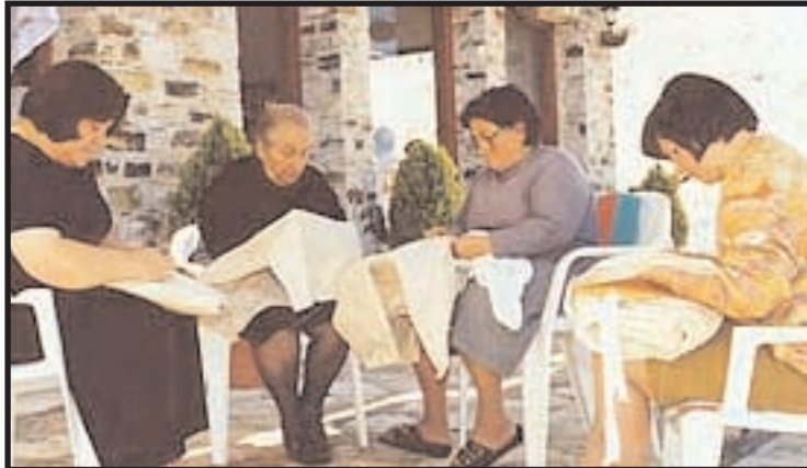
Hizmet sektöründe, enformel işlerde, ev eksenli üretimde kadınların emeği nitelikli emek sayılmıyor. Çünkü bu emek kadınların bakım için harcadıkları emeğin bir uzantısı gibi, kadınların doğal yatkınlıkları, doğal becerileri olarak görülüyor

Başka bir kadın ise işleme nedenini şöyle açıklamaktadır: "Mecburen işlemekteyim. Ben kızımı bu parayla okuttum. Beyimin işlediği anca yeterdi. Sırasında evimizin kahrını da çekti." Diğer bir kadın ise, "Ev