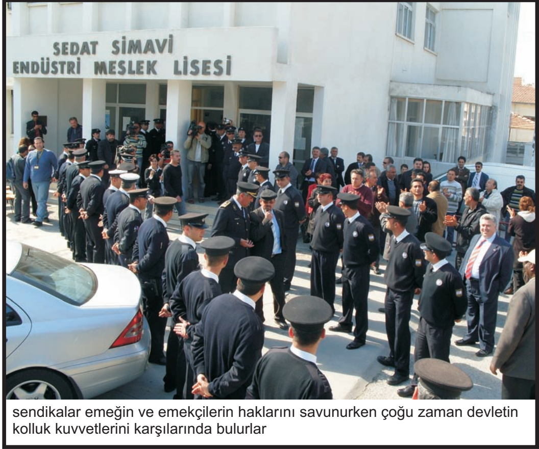
sendikalar emeğin ve emekçilerin haklarını savunurken çoğu zaman devletin kolluk kuvvetlerini karşılarında bulurlar

Grev çalışanların en büyük silahlarından biridir. Emekçiler haklarını korumak veya daha ileriye götürmek veya başka bir işyerindeki çalışanlarla dayanışmak amacıyla toplu olarak çalışmadıkları zaman buna grev denir. Grevler siyasi grev şeklinde de olabilir. Sendikaların ve emekçilerin grev dışında da onlarca mücadele şekli vardır. Grev silahı dengeli ve hedefine ulaşacak şekilde kullanılmalıdır.